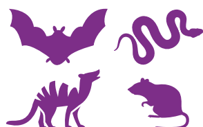
Chauves-souris et animaux sauvages