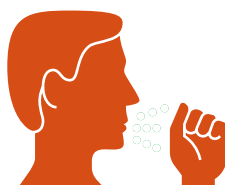
A propos des gouttelettes