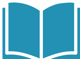
Lisez notre matériel d'information