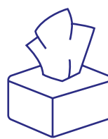
Couvrez votre bouche et votre nez

Lavez-vous les mains avec du savon pendant au moins 20 secondes.