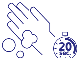
Lavage fréquent des mains

Lavez-vous les mains avec du savon pendant au moins 20 secondes.