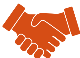
Par un contact direct