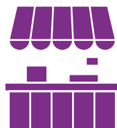
Contact avec des animaux vivants ou morts sur le marché des fruits de mer