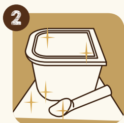
2 Hygiène: nettoyer le plan de travail et le matériel