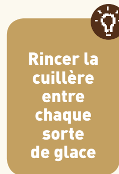
4 Rincer la cuillère entre chaque sorte de glace

Attention: ne PAS nettoyer la cuillère à glace dans le lave-vaisselle.