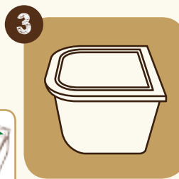
3 Fermer le bidon (prévient la cristallisation)