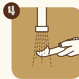
4 Rincer la cuillère entre chaque sorte de glace