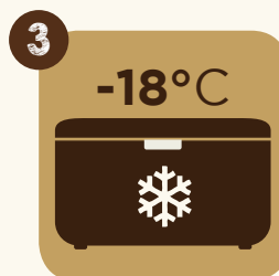
3 Conserver la glace dans un congélateur à -18^{\circ}\text{C}