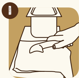
1 Rincer la cuillère à glace et laisser s'égoutter