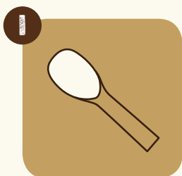
1 Lisser la glace dans le bidon avec une spatule