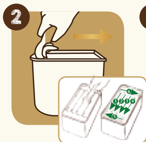
2 Proportionner la boule dans le sens de la longueur