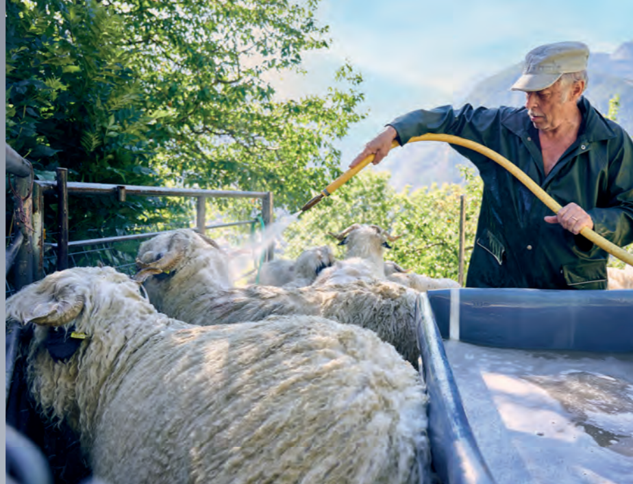
Dans la station de lavage, les moutons sont aspergés d'eau pour détacher la fine terre de la laine.