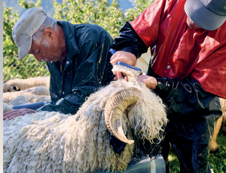
Les moutons sont shampooinés avec un produit de lavage doux pour mieux démêler la laine feutrée.