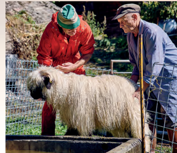
Après un rinçage minutieux, les moutons sont remis dans de l'eau claire afin qu'aucun résidu de savon ne reste accroché à la laine.