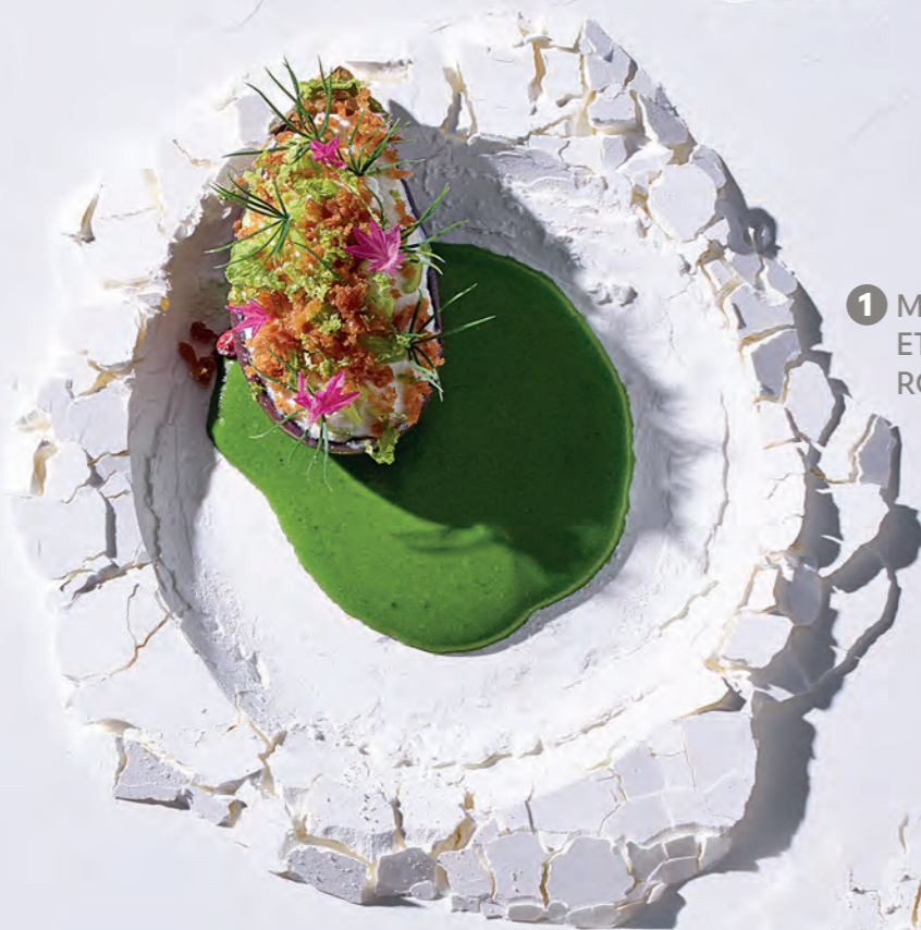
1 MINI-AUBERGINE GRILLÉE ET SAUCE CRÉMEUSE À LA ROQUETTE