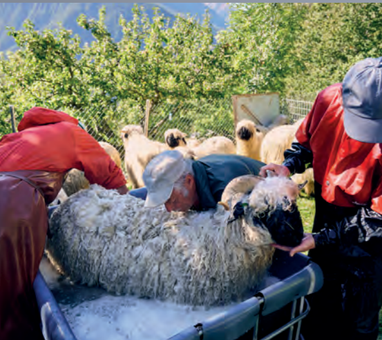
Pour éviter un choc thermique et habituer les animaux en douceur à l'eau, on les place dans un bassin d'eau tiède.