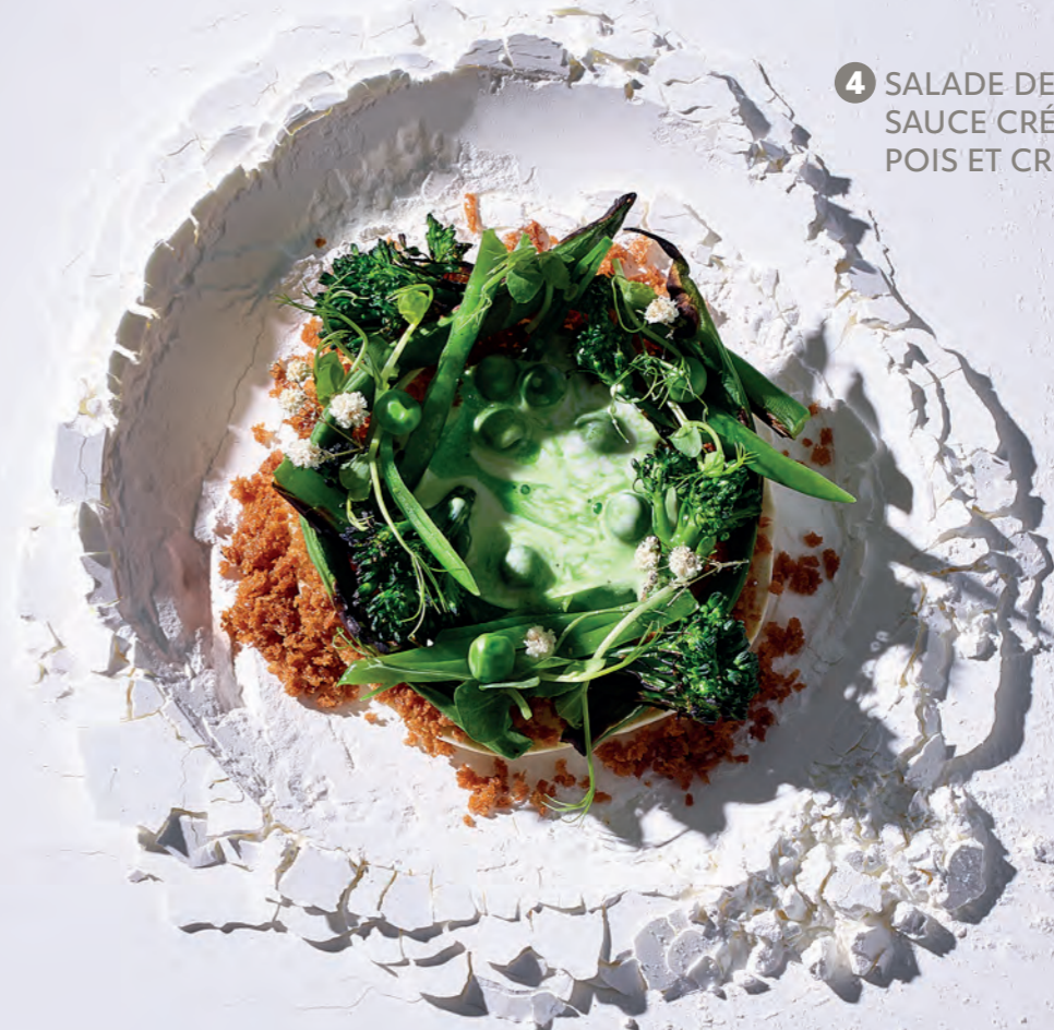
4 SALADE DE LÉGUMES TIÈDES, SAUCE CRÉMEUSE AUX PETITS POIS ET CRUNCH DE PANKO

1 Sauce à la roquette : 50 g échalotes 4 cl Oliogastro Crème à rôtir 2 dl Knorr Professional Bouillon de légumes nature , préparée 2 dl Knorr Professional Crème culinaire, à base végétale roquette 150 g sel et poivre