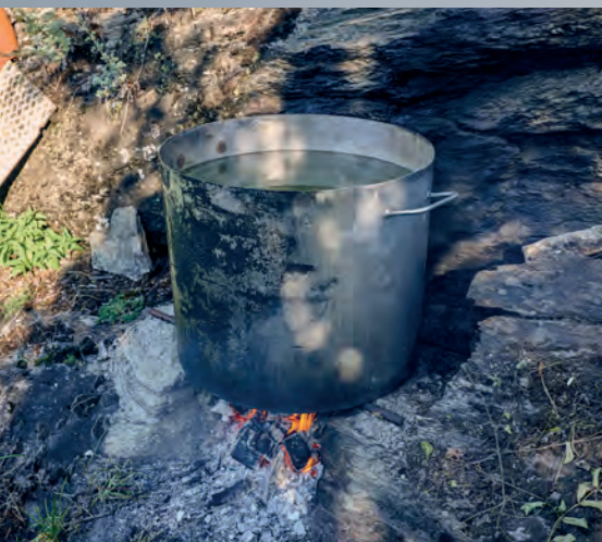
L'eau est chauffée de manière tout à fait traditionnelle dans une grande marmite sur le feu, puis versée dans le bassin froid.

Pour Viktor, le concours d'automne est bien plus qu'une compétition, car la rencontre avec d'autres éleveurs est une tradition transmise au fil des années et en même temps une belle fête qui fait partie de la culture.