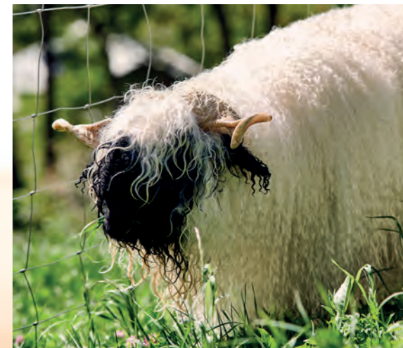
Fraîchement toiletté, le mouton nez noir est prêt pour le concours d'automne – un moment où des mois de soins et de travail d'élevage se révèlent.