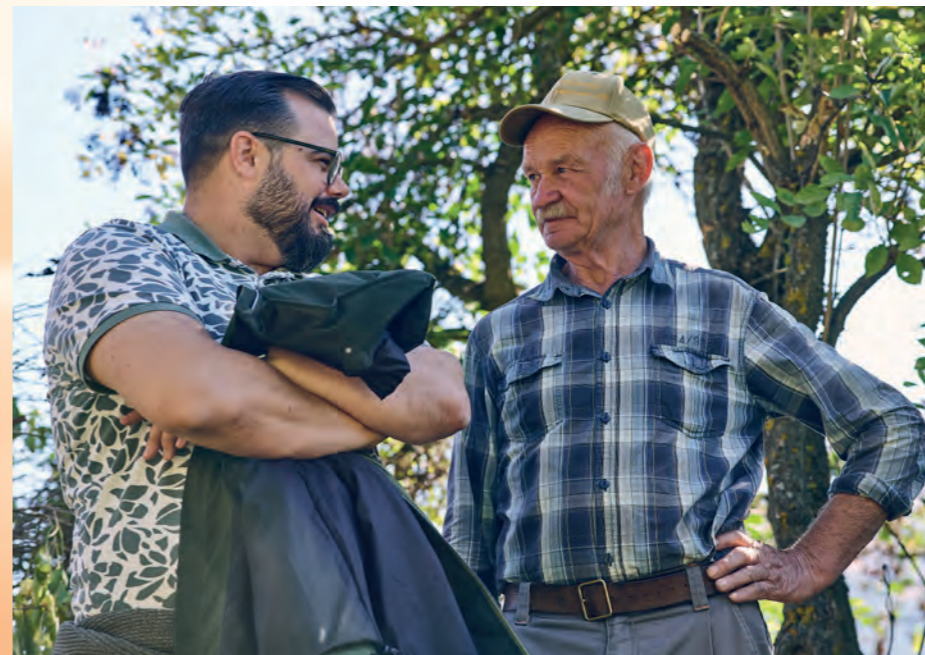
La présentation d'automne vit de la rencontre entre les éleveurs. C'est une fête conviviale de rencontres et de traditions vivantes autour des moutons à nez noir du Valais.