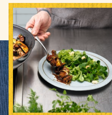
Kalbsleber mit dem Salat anrichten