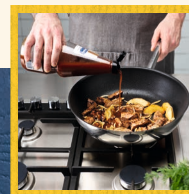
Mit Hellmann's Vinaigrette ablöschen